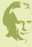
KARL THEODOR JASPERS (1883 – 1969)

Der gebürtige Oldenburger und Ehrenbürger der Stadt war Psychiater und Philosoph. Er gehört zu den Wegbereitern einer Psychiatrie, die den Menschen in den Mittelpunkt stellt. Bevor er als herausragender Vertreter der sogenannten Existenzphilosophie zu einem der bedeutendsten deutschsprachigen Philosophen des letzten Jahrhunderts avancierte, war er als Psychiater tätig und forschte an der Universität Heidelberg. Seine Habilitationsschrift »Allgemeine Psychopathologie« gilt noch heute als wissenschaftliches Standardwerk.