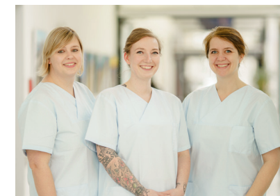
DEIN TEAM DEINE AUSBILDUNG