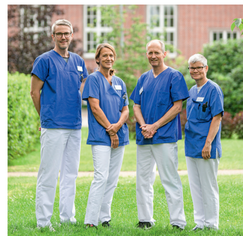
DIE FREIGESTELLTEN PRAXISANLEITERINNEN UND -ANLEITER (LINKS KJK, RECHTS AK) SIND DEINE FESTEN BEZUGSPERSONEN.

Wir lieben unseren Beruf – und bilden von Herzen aus.